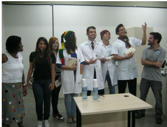
Grupo de alunos se apresenta durante Semana Acadêmica no campus São Gonçalo

Os campi do IFRJ podem enviar à Pró-Reitoria de Extensão (Proex), até o dia 23 de março, propostas para a realização de Semanas Acadêmicas, que deverão ocorrer no período de maio a novembro de 2016.