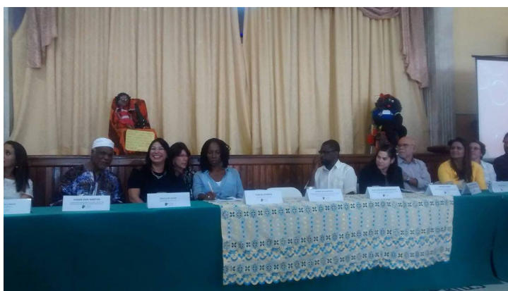
Segunda edição do Flidam recebeu artistas e pensadores da cultura afro-brasileira