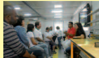
Estudantes do curso técnico em Lazer em aula no Laboratório Móvel, em laboratório multidisciplinar recebido da Rede e-Tec Brasil.

Estudantes dos cursos Técnicos em Serviços Públicos, em Lazer e em Agente Comunitário de Saúde reuniram-se no CANP, em agosto, para a primeira edição de 2012 do encontro presencial do Núcleo de Educação à Distância (NE@d).