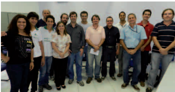
Confira na página IFRJ – Pinheiral a listagem dos membros do colegiado do CANP.